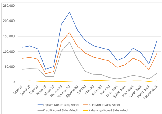
Tablo 1: 1. çeyrek konut satış adetleri karşılaştırma